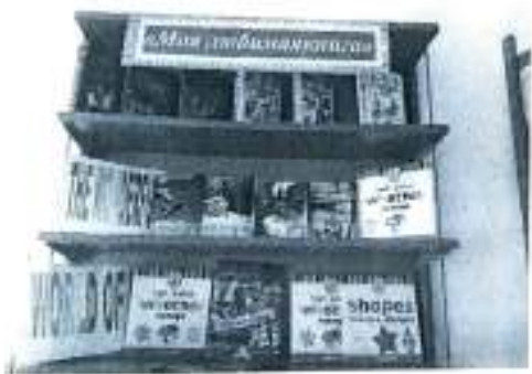
«Моя любимая книги»

Нравится Beabaeva Анар, Би және 27 aidabulsakaya_sh Көпшілік выставка "Мейірім төгетін ана" #Зерендауданы #Зерендауданы #зоо_зоо2 @zoo_sou_87082194864 #өзін_өзі_тану_пәнінде2022 #декадапосамолданино2022