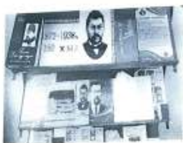
А Байтұрсынов 150ж

Түркістан облысының аймақтары, аймақтар, аймақтар Участниктер: ұжымдар 6 Б және 5 Б және Қосымша: құрамындағы